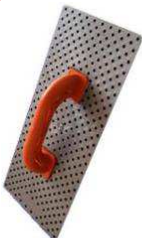
Taloche de ponçage sans papier Pour polystyrène