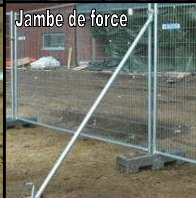
Jambe de force